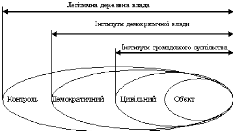
Рис. 1. Співвідношення ознак «демократичний» і «цивільний» у складних термінах стосовно контролю над військовою організацією держави

Отже, без вирішення задачі подальшої демократизації вирішити задачу євроінтеграції неможливо.